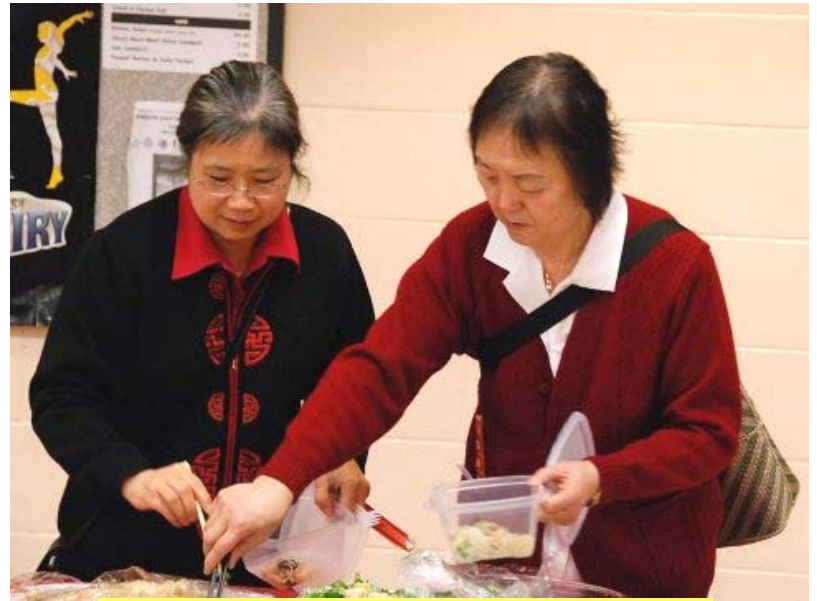
趁着别人还没开吃，咱俩先尝点热乎的。