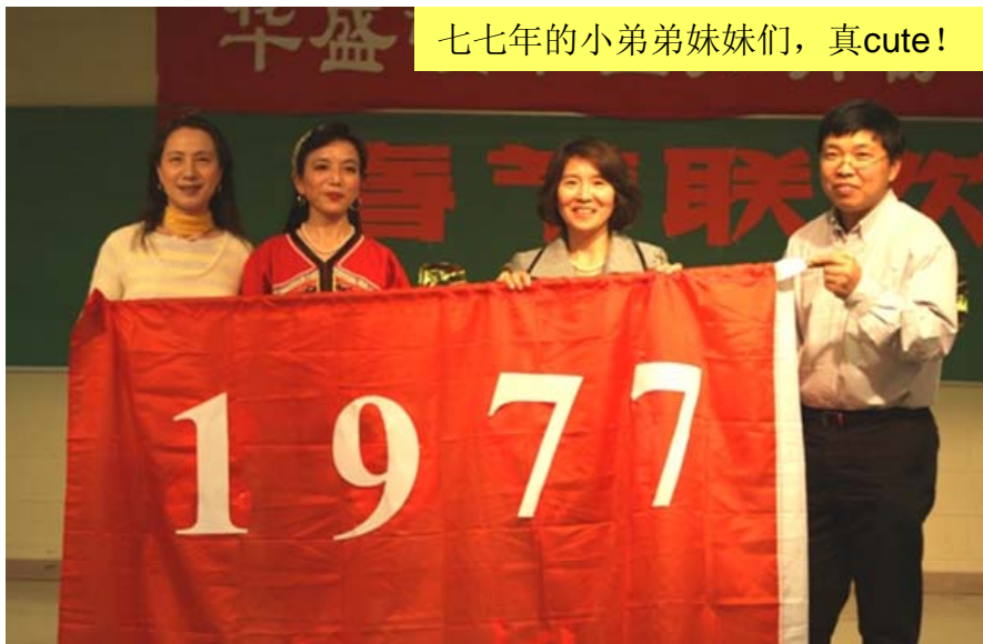
花生屯知青家谱——1977年