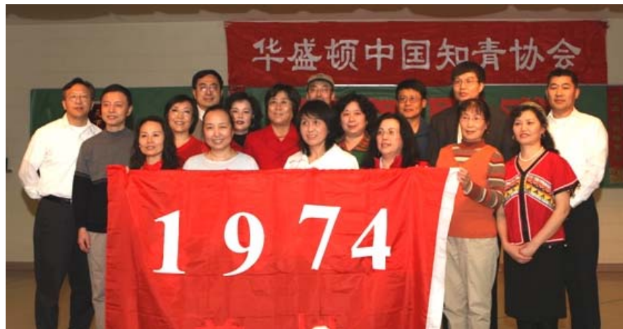
花生屯知青家谱——1974年