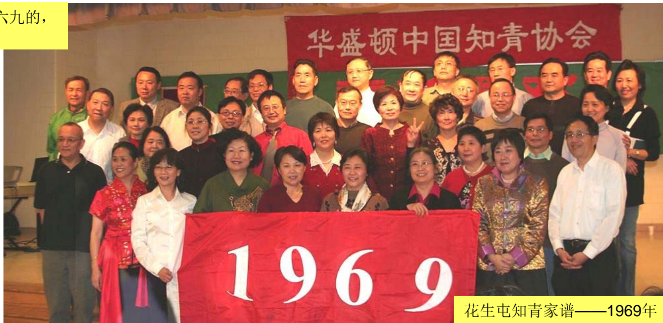
花生屯知青家谱——1969年