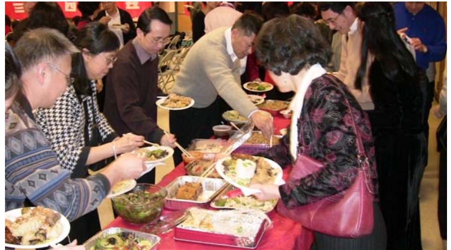
百家饭，五颜六色，色香俱全。