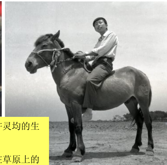
电影《牧马人》里许灵均的生活原型。 咦？他们不是要留在草原上的吗？怎么都跑到华盛顿来了？——这世道变啦！