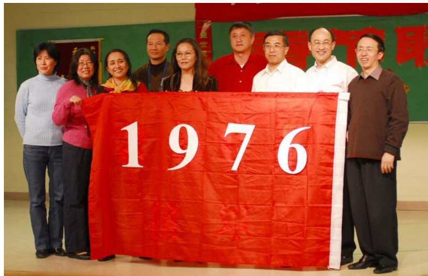
花生屯知青家谱——1976年