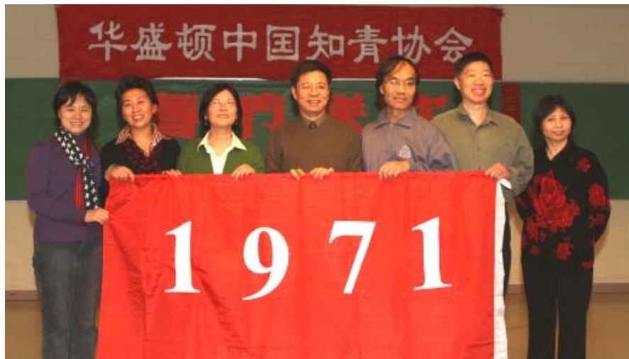
花生屯知青家谱——1971年