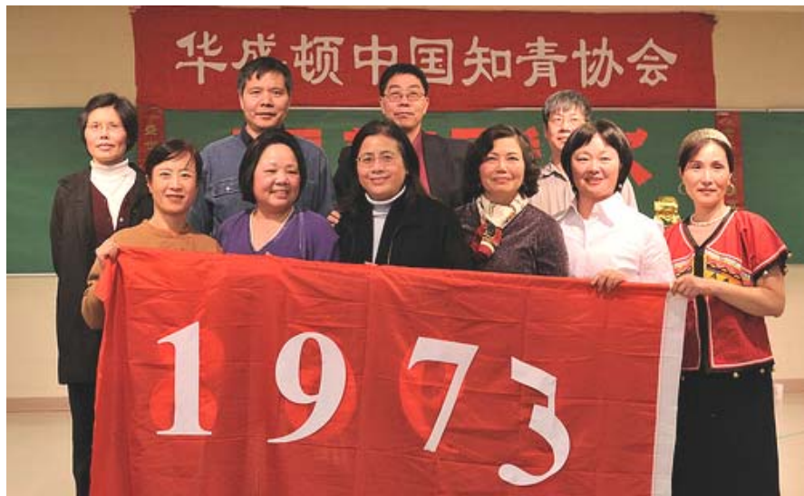
花生屯知青家谱——1973年