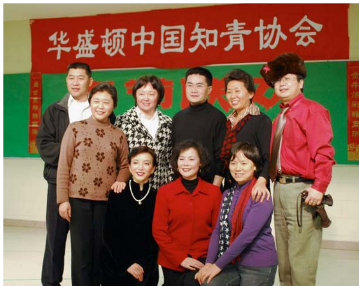
花生屯里最有战斗力的部队 - 川军