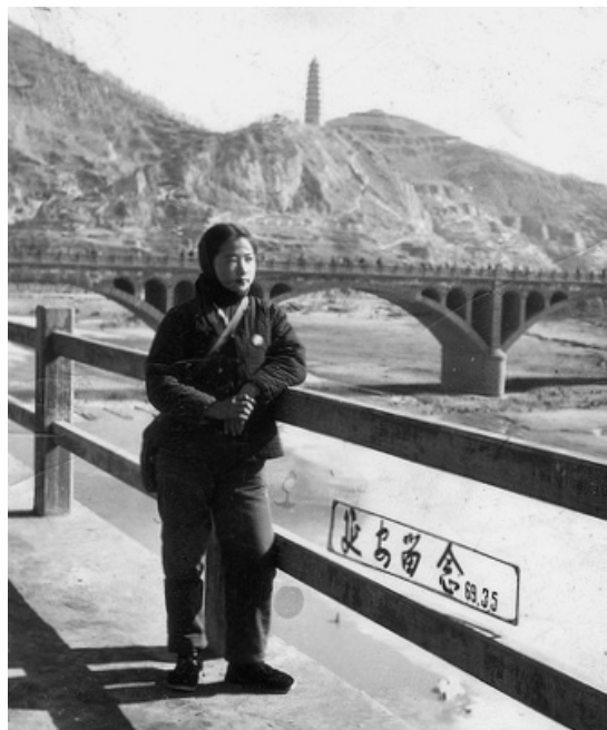
滚滚延河水 巍巍宝塔山 小怡望北京 盼着把家还