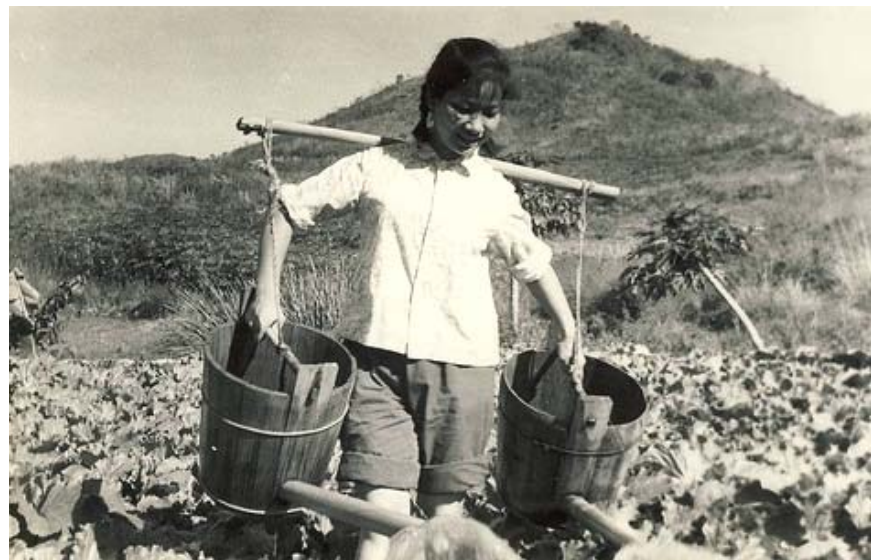
可惜奥运会没有《担水》的比赛项目。要是有的话，咱们的丹穗一定稳拿《担水》项目最轻量级的世界冠军！