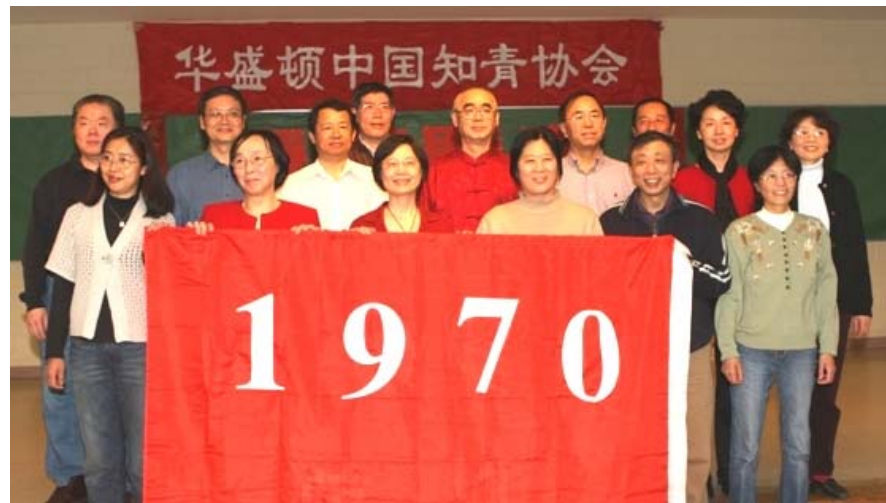
花生屯知青家谱——1970年