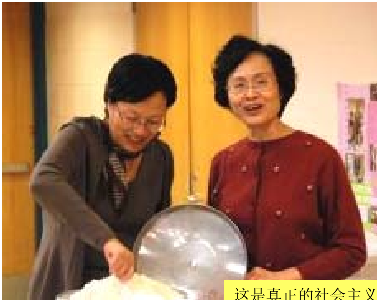
这是真正的社会主义大锅饭，够你们五十个人吃的！