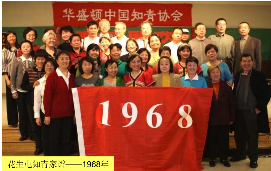
花生屯知青家谱——1968年