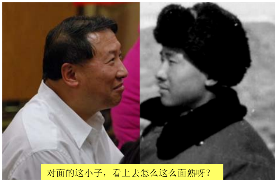
对面的这小子，看上去怎么这么面熟呀？