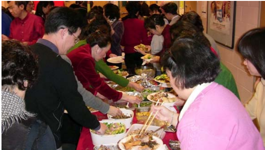
大队人马来了！但次序井然。