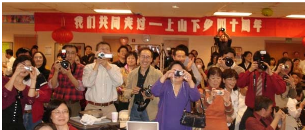
大家都挤到前面拍照，谁也不想错过这宝贵的一瞬间。