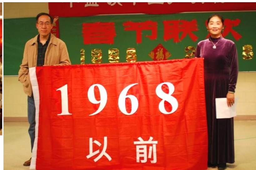
今夜知青中的佼佼者：龙哥和凤姐