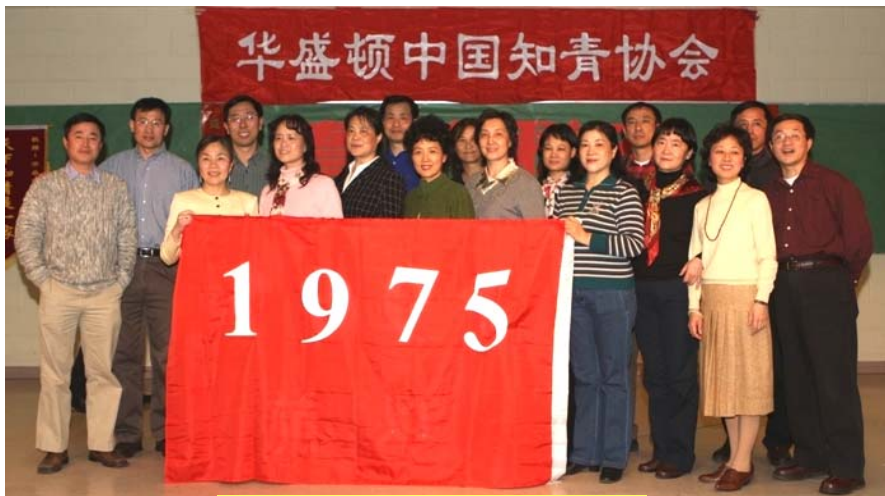
花生屯知青家谱——1975年