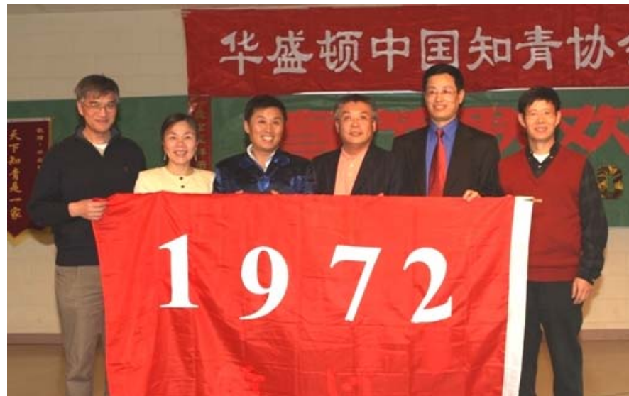
花生屯知青家谱——1972年