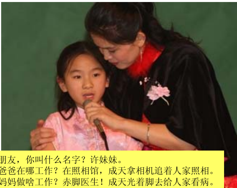
小朋友，你叫什么名字？许妹妹。 你爸爸在哪工作？在照相馆，成天拿相机追着人家照相。 你妈妈做啥工作？赤脚医生！成天光着脚去给人家看病。