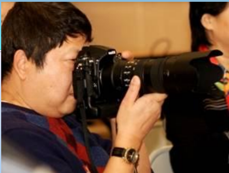
训练有素的摄影师！