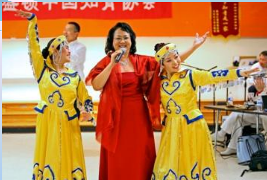
给知青唱歌，还有姐妹们伴舞，越唱越高兴！