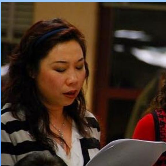
正牌的女高音歌唱家在这哪！ 她既能在音乐厅里唱阳春白雪，也愿意和知青玩下里巴人。