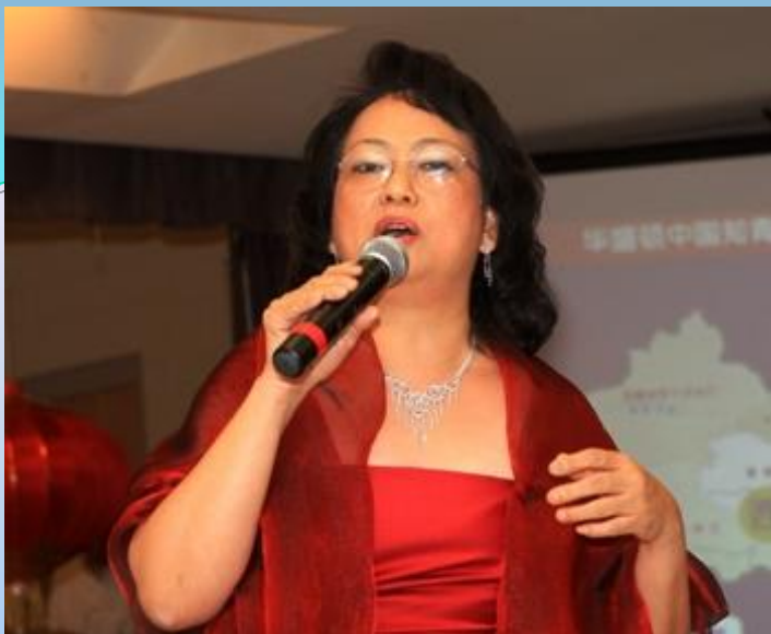
著名女中音张丽慧，对知青伙伴们情有独钟。献上一首《美丽的草原我的家》。