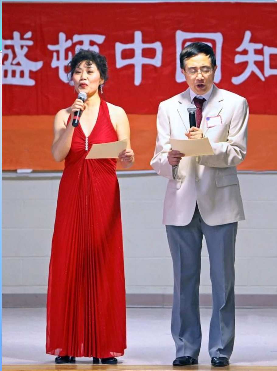
晚会的两位主要筹备者兼主持人。 一位唱红脸，一位唱白脸。