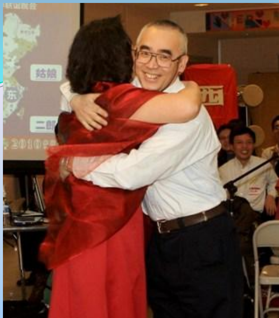
老马的精彩表演，受到剧组里女一号的嘉奖。