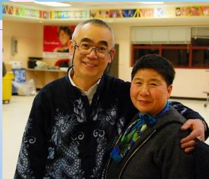
演完后，赶紧跟夫人献殷勤。一边表示亲热，一边不停的解释：那，那，那是剧情发展的需要！