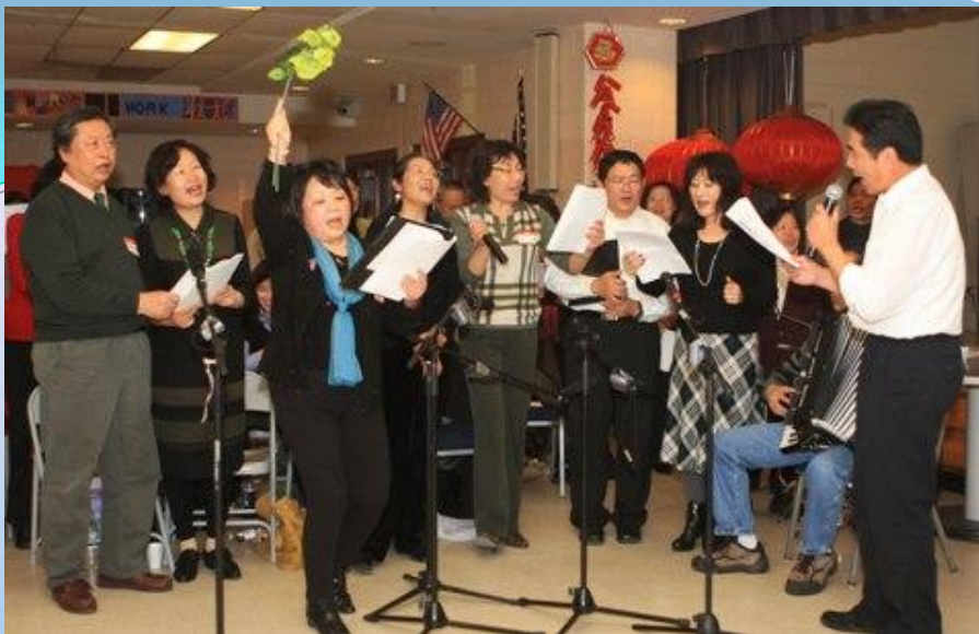
南区的指挥，手擎一枝橄榄枝，独树一帜！