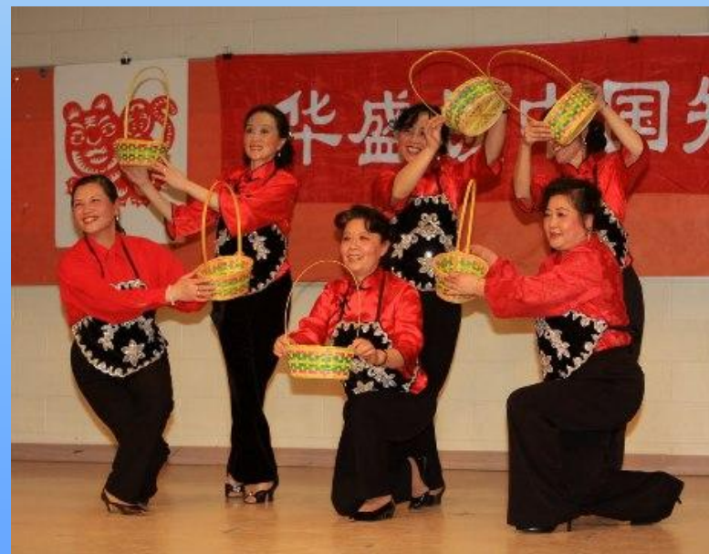
我编斗笠送知青，东西南北一家亲。