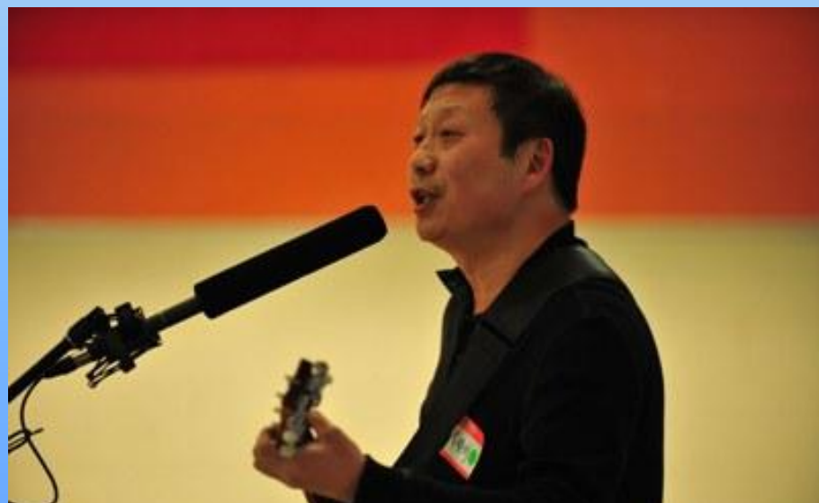
吉他手，情不自禁！他唱的啥？ Who cares! 只要他 enjoy 就行！