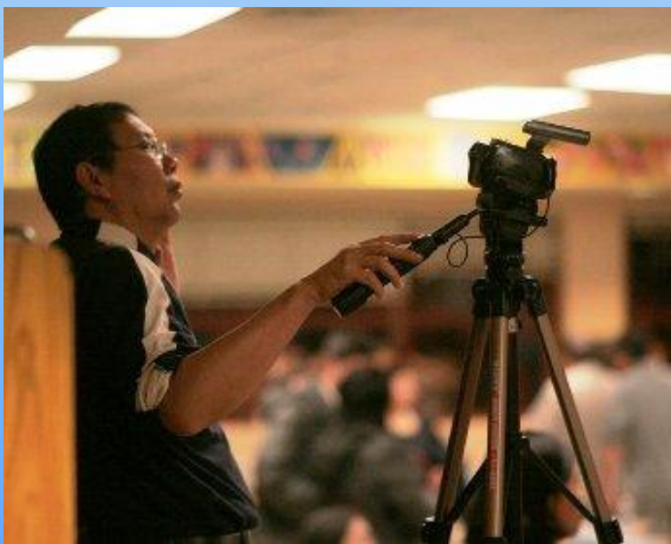
专业的摄影师！专拍花生屯的《新闻简报》。