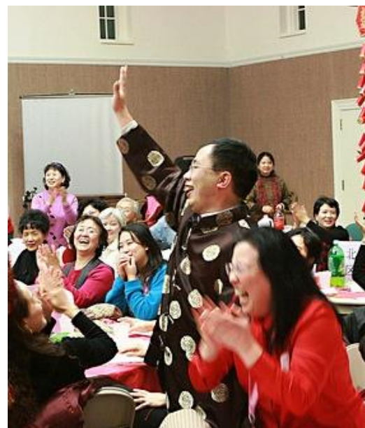
同志们， 我们的大会是一个团结的大会，胜利的大会！