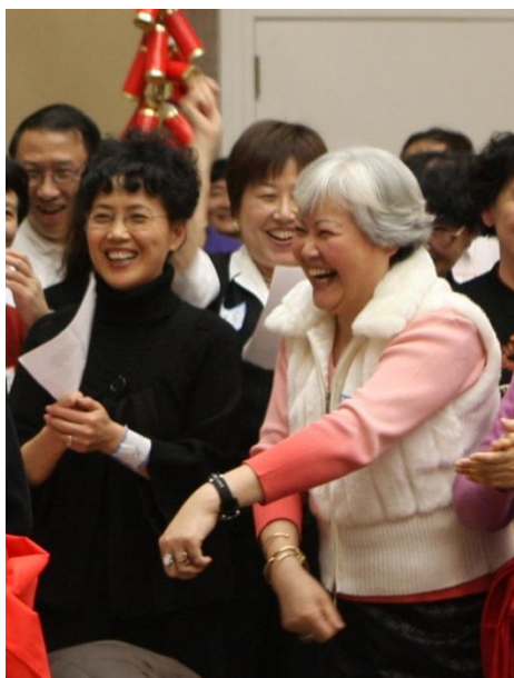
你这小子, 太有才 了!