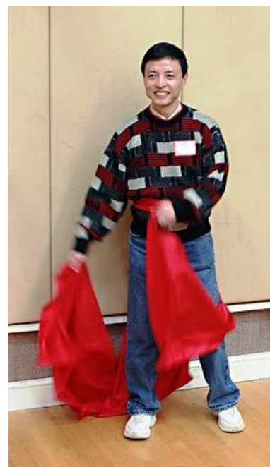
这辈子头一回跳舞，怪不好意思地...