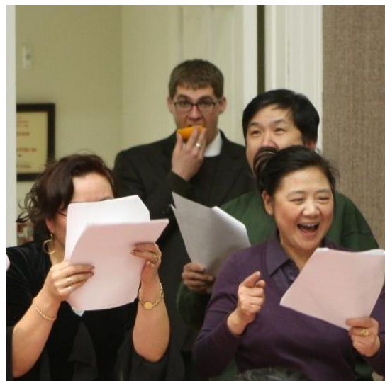
吃自己的橘子,让别人唱去吧!