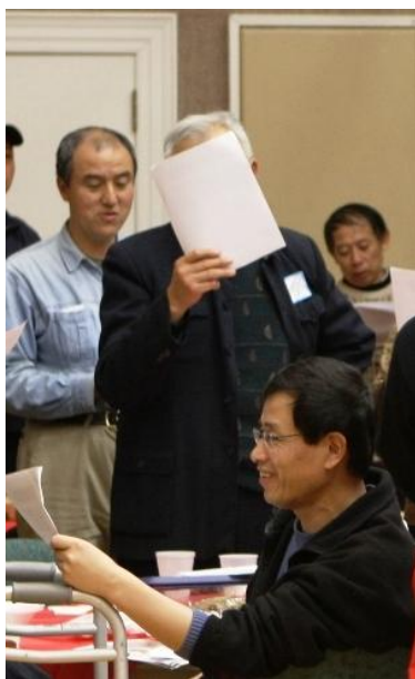
在蒋委员长的面前，三十五军苗军长吓得连脸都捂起来了！