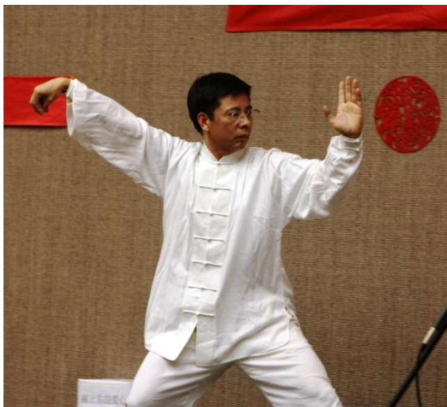
猜谜:飞翔吧,飞翔吧!(打一对象青夫妇)